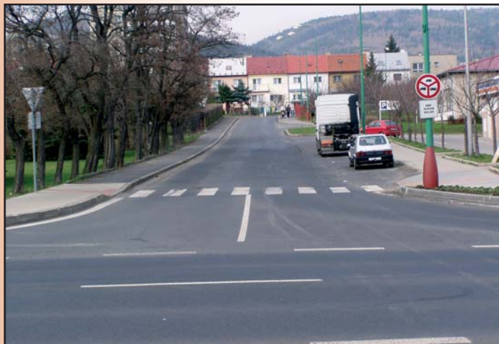
■ Křižovatka u kulturního domu

ků kolem panelových domů. Připraveno je stavební povolení na parkoviště v Žitné ulici a zlepšení průjezdnosti silnice I/13 v oblasti autobusové zastávky u Kulturního domu a křižovatky u Odety.