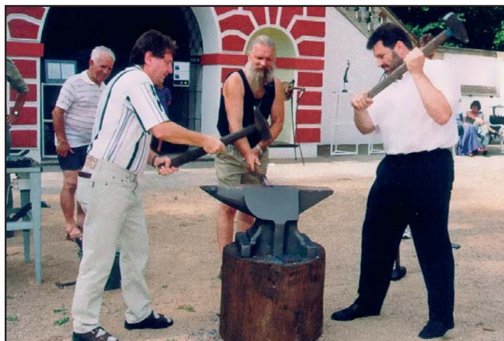
■ Eurokov 2000 je setkáním uměleckých kovářů

Součástí zámeckého areálu je sala terrena, která vznikla za třicetileté války po opravě zámku, který byl v roce 1639 poškozen požárem. Sala terrenu dal postavit Michael Oswald Thun, který se také zasloužil o založení rozsáhlého a cenného anglického parku. Na výzdobě sala terreny se významně podílel sochař Jan Brokoff.