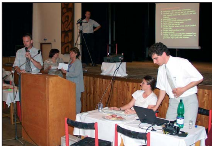
■ Účastníci projektu Agora

Výstavba supermarketu by měla být vyřešena v krátkodobém horizontu, protože se stala dlouhodobým problémem, který trápí nejen radnici, ale také obyvatelé města, jak ukázal projekt AGORA.