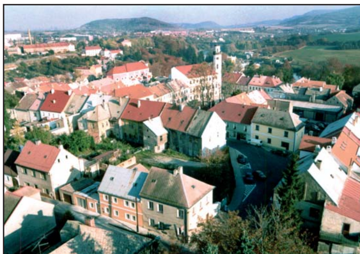
■ Klášterec nad Ohří v roce 2000

Snad nejvýznamnější událostí letošního roku byly i pro naše město volby do krajského zastupitelstva a do Senátu Parlamentu ČR, které proběhly v Klášterci nad Ohří bez sebemenších problémů. Na spl-