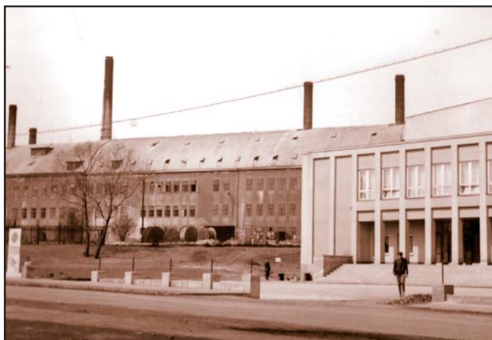
■ Objekt staré porcelánky v Klášterci nad Ohří

Ve městě je stále dost objektů, které by si zasloužily opravu a lepší využití. Například tolik diskutovaná stará porcelánka nebo budova Unionu v Miřeticích. Trvale se musí udržovat stávající veřejné osvětlení a rozšířit osvětlení i do nově vznikající obytné zóny v Miřeticích. Odbor se zabývá věčným problémem psů a koček. Snaží se zavést čipovou evidenci psů, pravidelné oč-